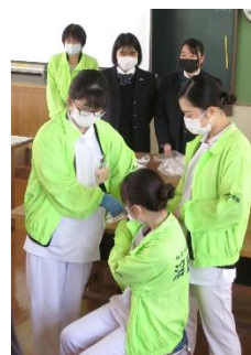
古見先生・米山先生 鈴木先生・涌井先生