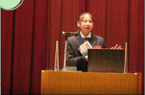
全国高等学校ビブリオバトル2021群馬県大会